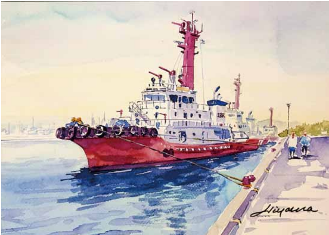
消防防災船ほうおう 水彩画 檜山雄二