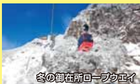
冬の御在所ロープウェイ

①希望賞品(①又は②)・②住所(郵便番号必須)・③氏名・④年齢・⑤本紙ひばりの入手法、A(自宅記布)、B(その他・具体的に)⑥本誌「ひばり」や「いなべ市の観光」「いなべ市農業公園」「六石高原ホテル・六石温泉(あじさいの湯)」「にぎわいの森」「さくらポーク松葉」「石慶」「御在所ロープウェイ」などについてのご感想・ご意見等(どれでも、いくつでも可)をご記入の上、下記にお申し込み下さい。