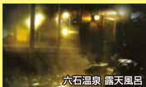
六石温泉 露天風呂