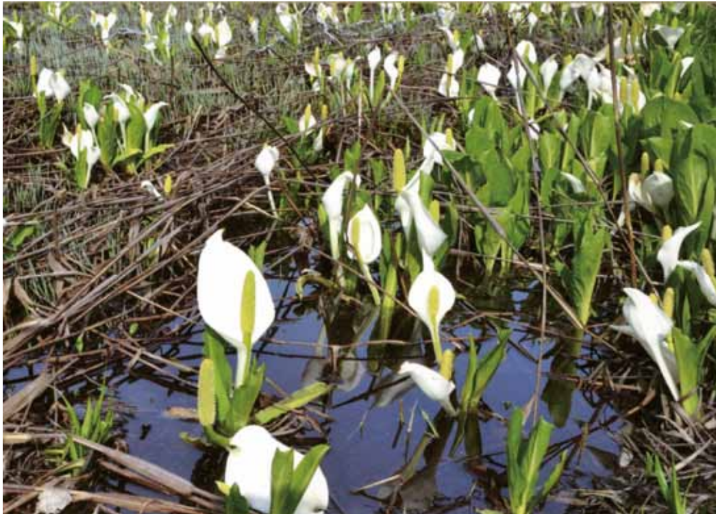
「美しい思い出 青森県十和田市」