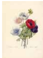
ピエール＝ジョセフ・ルドゥーテ《アネモネ》『美花選』より 1827-33年刊 銅版、手彩色・紙 コノサズ・コレクション東京蔵