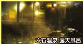
六石温泉 露天風呂

①希望賞品(①又は②)・②住所(郵便番号必須)・③氏名・④年齢・⑤本紙ひばりの入手法、A(自宅配布)、B(その他・具体的に)⑥本誌「ひばり」や「いなべ市の観光」「いなべ市農業公園」「六石高原ホテル・六石温泉(あじさいの湯)」「阿下喜温泉あじさいの里」「さくらポーク松葉」「石慶」などについてのご感想・ご意見等(どれでも、いくつでも可)をご記入の上、下記にお申し込み下さい。