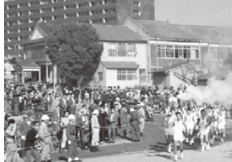
県庁を出発する聖火リレー