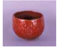
松平定信《赤茶碗》 (桑名市博物館蔵)