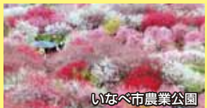
いなべ市農業公園

①いなべ市農業公園 梅まつり入園券 ②六石温泉あじさいの湯入浴券を 各々5組10名様にプレゼント!