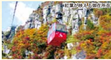
紅葉が映える御在所岳 16ページにプレゼントのお知らせを掲載していますので、ご覧ください。