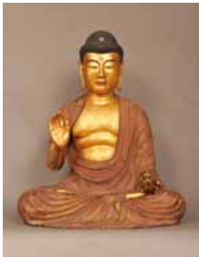
真巖寺 木造薬師如来坐像