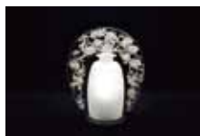
ルネ・ラリック 「大型常夜灯 《日本のリンゴの木》」1920年