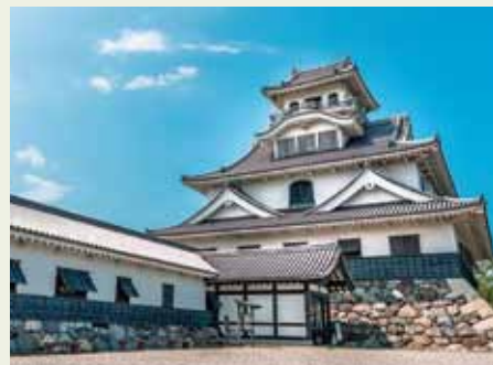
長浜城歴史博物館