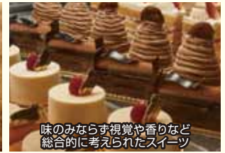
味のみならず視覚や香りなど総合的に考えられたスイーツ