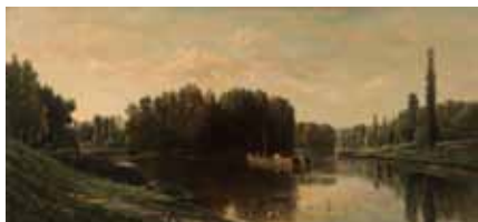
シャルル=フランソワ・ドービニー 《オワーズ川の中州》 1860年頃 公益財団法人村内美術館蔵

【内容】19世紀フランスを代表する風景画家の 1人で、印象派にも大きな影響を与えた シャルル=フランソワ・ドービニー (1817-1878) の国内初の本格的な 展覧会(巡回展)。船にアトリエを備え付 けた「アトリエ船」を愛用し、みずみず しい筆致で穏やかな風景を描いたドービ ニーによる油彩画・版画等に加え、同時 代の周辺画家による作品もご紹介しまし ます。