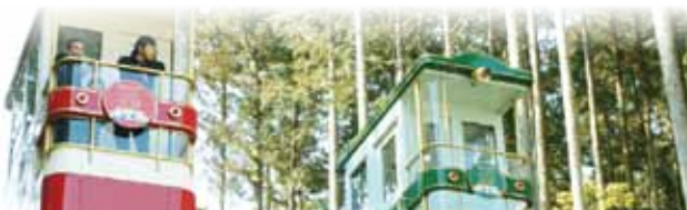
伊勢湾を望む、希望荘のケーブルカー