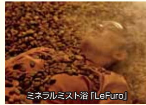
ミネラルミスト浴「LeFuro」