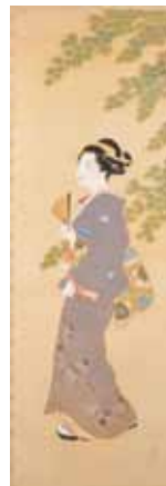
伊藤小坡(一覽) (桑名市博物館蔵)